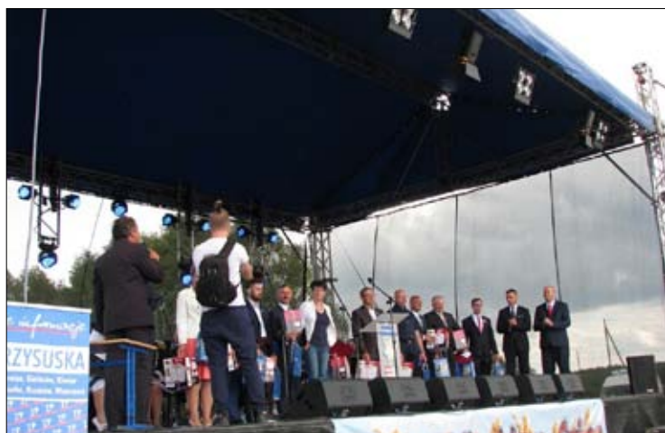
Wręczenie rolnikom odznak honorowych „Zasłużony dla Rolnictwa”.