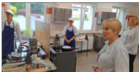
Egzaminy zawodowe to ważny krok w życiu każdego ucznia szkoły.