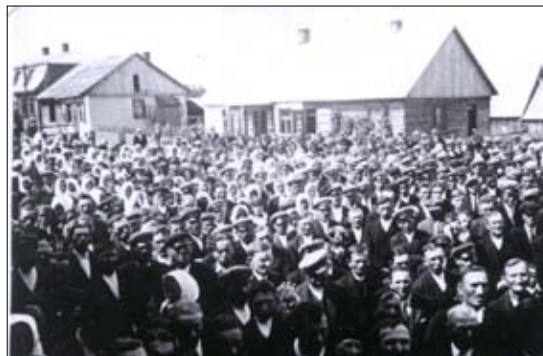
Zebranie gminne w Borkowicach – 1935 rok