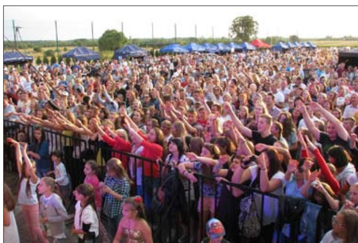
Liczne atrakcje uroczystości dożynkowych przyciągnęły do Rusinowa tłumy.