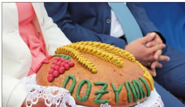
... specjalnie przygotowanego na uroczystość.