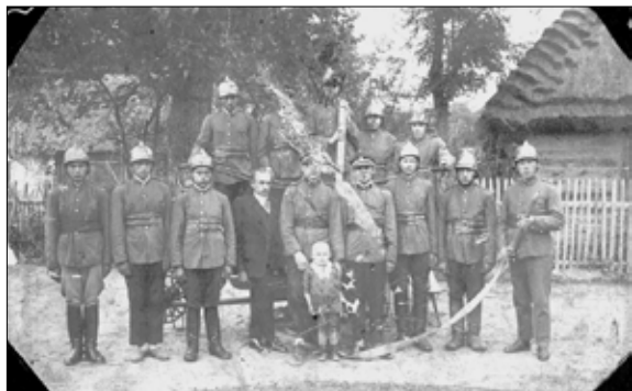
Ochotnicza Straż Ogniowa w Borkowicach – 1931 rok