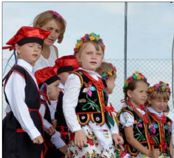
Występ dzieci z Samorządowego Przedszkola w Gałkach.