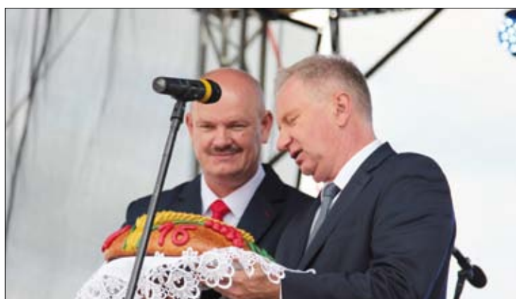
Starosta i Wójt obiecali dzielić otrzymany z rąk starostów dożynkowych chleb sprawiedliwie.