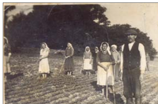
Prace polowe w Radestowie - 1936 rok