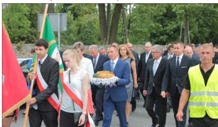
Korowód tworzyli przedstawiciele władz, zaproszeni goście i mieszkańcy powiatu - uczestniczący w dożynkach.