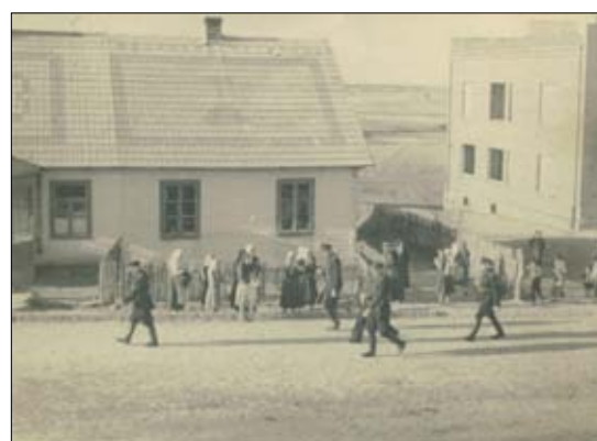
Patrol Policji Państwowej w drodze do aresztu gminnego w Borkowicach - 1938 rok.