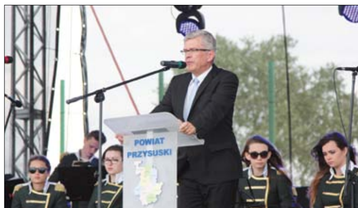
Głos zabrał również Marszałek Senatu RP Stanisław Karczewski.