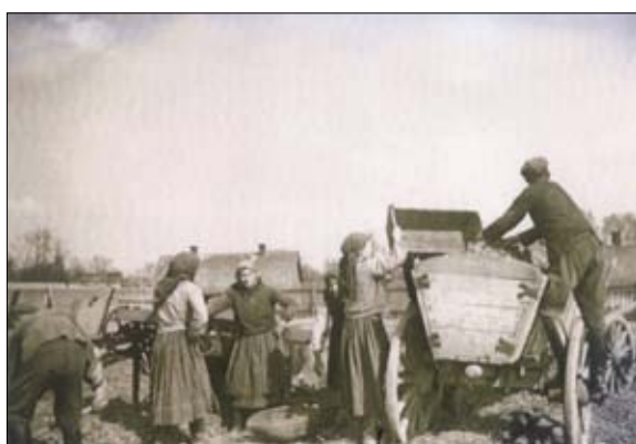
Wykopki w Radestowie – 1938 rok