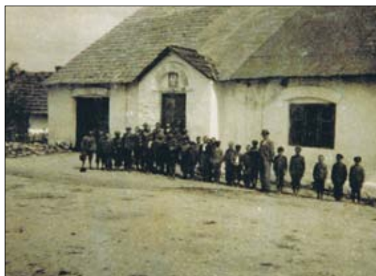
Szkoła w Ruszkowicach – 1922 rok