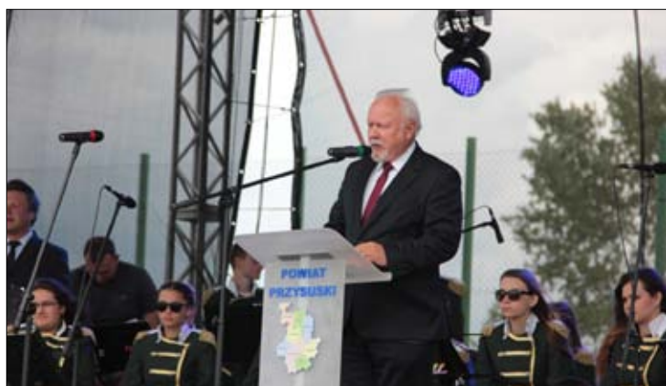
Przemawiali również poseł Dariusz Bąk...