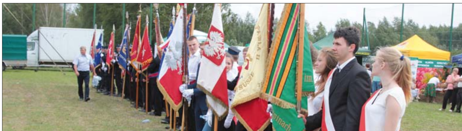
Splendoru dodawały liczne poczty sztandarowe podkreślające znaczenie tegorocznych dożynek w Rusinowie.