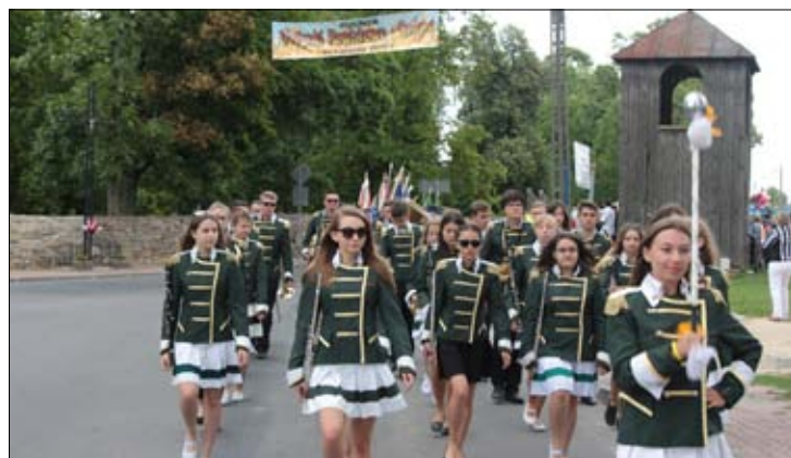
Korowód dożynkowy z kościoła prowadziła powiatowa orkiestra dęta VOX CORDIUM.