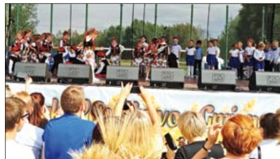
Publiczność gorąco zareagowała na występ przedszkolaków.