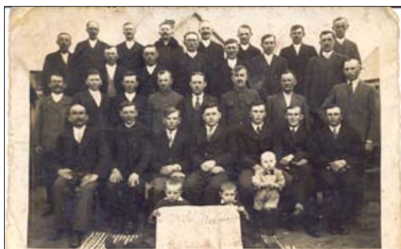
Koło Rolnicze „Nowość” w Ruszkowicach – 1938 rok