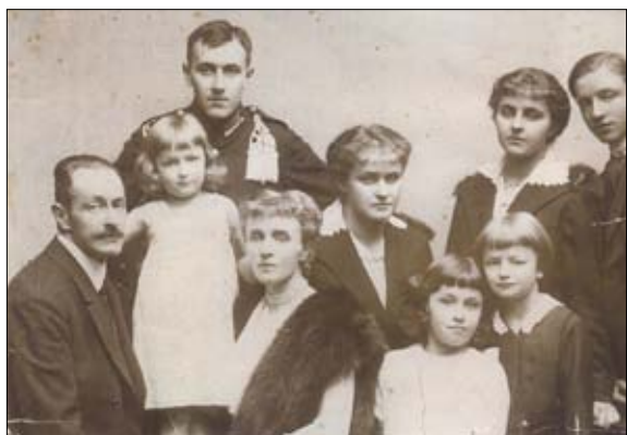
Dembińscy z Borkowic herbu Nieczuja – 1919 rok