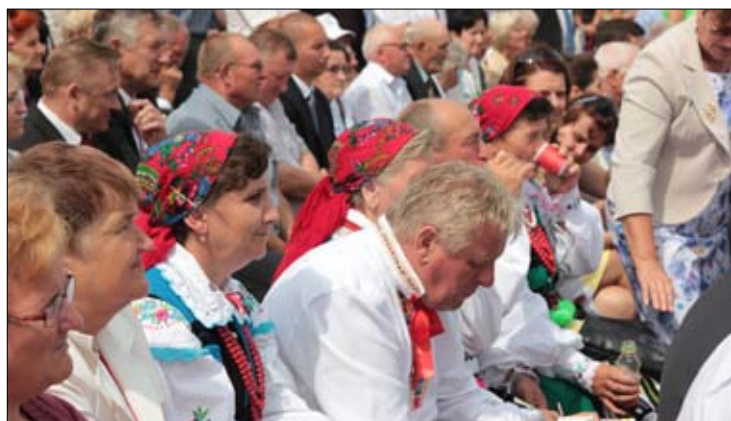
Ludowość trzeba mieć w sercu.