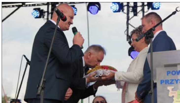
Następnie odbył się obrzęd przekazania dożynkowego chleba...