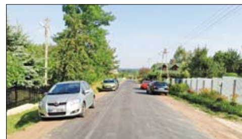
Droga powiatowa w Kolonii Szczerbackiej po remoncie.

Nr 3326W dr. Nr 48 – Podczasza Wola – Kozieniec – Potworów. Zadanie nr 3: Remont drogi powiatowej Nr 3314W Odrzywół – Kadz – Łojków. Zadanie nr4: Remont drogi powiatowej Nr 3341W Jabłonica – Pogroszyn. Zadanie nr5: Remont drogi powiatowej Nr 3340W Długa Brzezina – Bryzgów – Stefanków. Zadanie nr6: Remont drogi powiatowej Nr 3313W Drzewica – Rusinów – Sady Kolonia. Zadanie nr7: Remont drogi powiatowej Nr 3329W Potworów – Jamki – Skrzyńsko. Zadanie nr 8: Remont drogi powiatowej Nr 3329W Potworów – Jamki – Skrzyńsko – chodnik m. Wistka. Zadanie nr9: Remont drogi powiatowej Nr 3320 W Karczówka – Goździków. Zadanie nr10: Remont drogi powiatowej Nr 3322W Drzewica – Bieliny – Gielniów. Zadanie 11: Przebudowa przepustu w ciągu drogi powiatowej nr 3311W Rusinów - Brogowa - Janików w km 5+116 w miejscowości