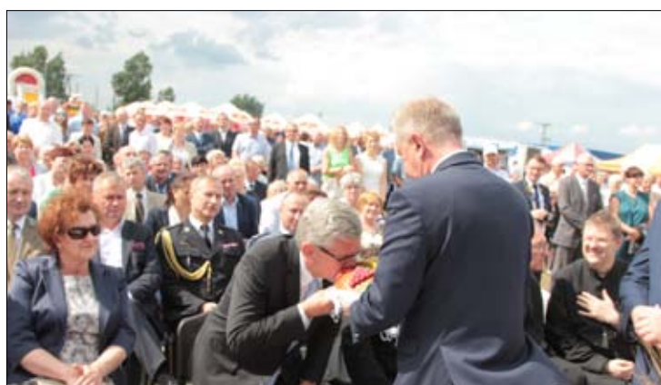
Starosta dzielił chleb między gości. Pierwszy kawałek dla Marszałka Senatu, który reprezentował najwyższe władze Rzeczypospolitej na naszej lokalnej uroczystości.