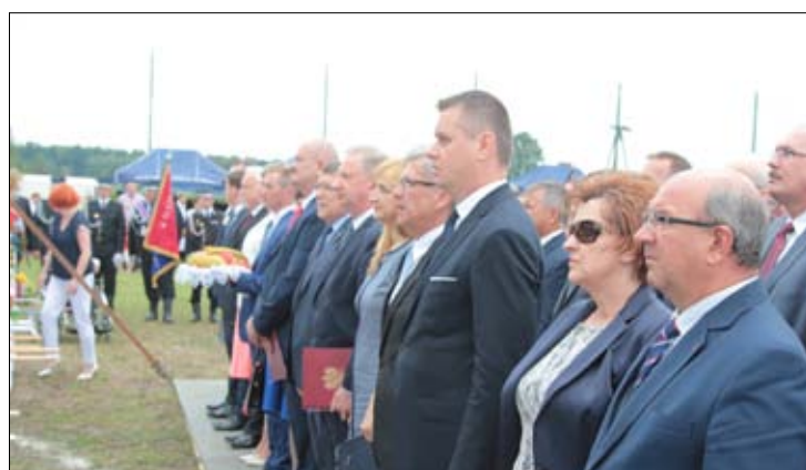
Uroczystość rozpoczęła się od hymnu państwowego.