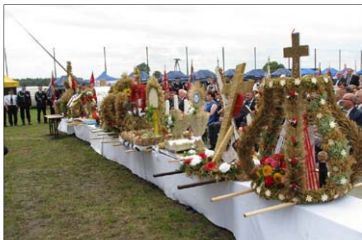
Wieńce dożynkowe z gminy Rusinów i innych gmin powiatu przysuskiego