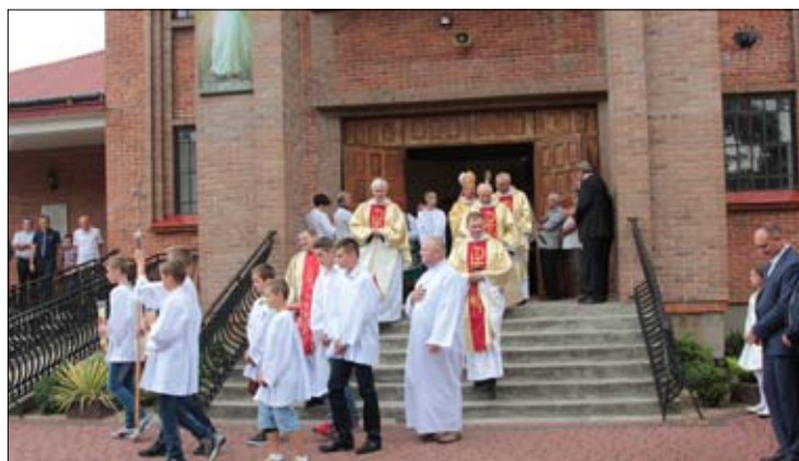
Pierwszą część uroczystości stanowiła msza św. koncelebrowana pod przewodnictwem ks. Biskupa Adama Odzimka.